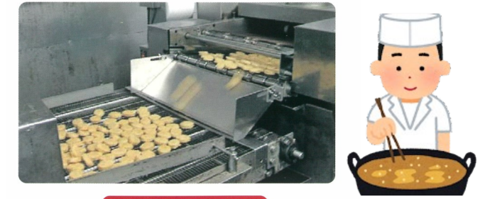
カラット君設置図